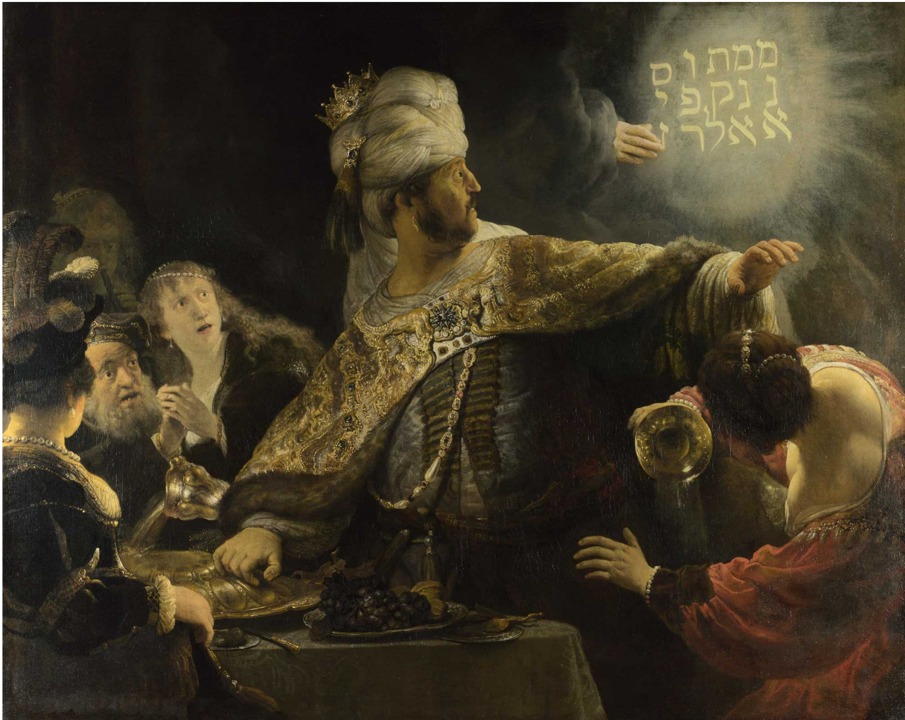
Rembrandt: Belshazzar's Feast.